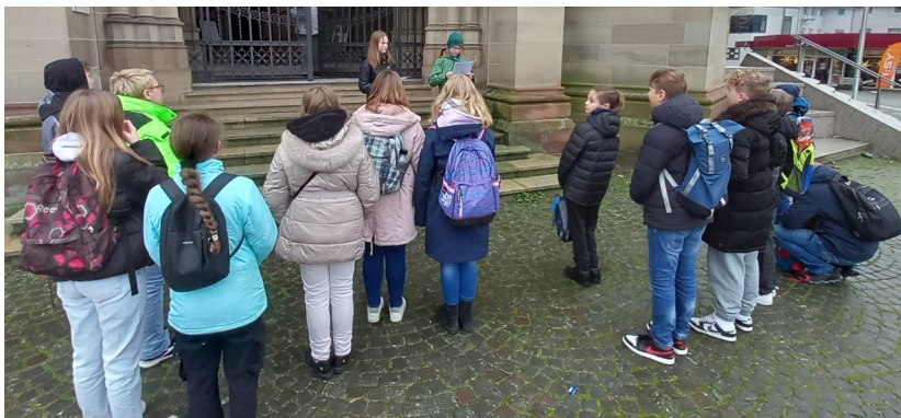
Konfis und Präpis vor der Gedächtniskirche