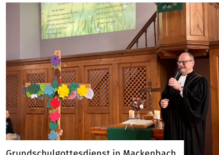
Grundschulgottesdienst in Mackenbach

Die Tage bis Ostern wurden in unseren drei Gemeinden von ebenso zahlreichen wie intensiven Gottesdiensten begleitet. Hier ein paar Eindrücke: