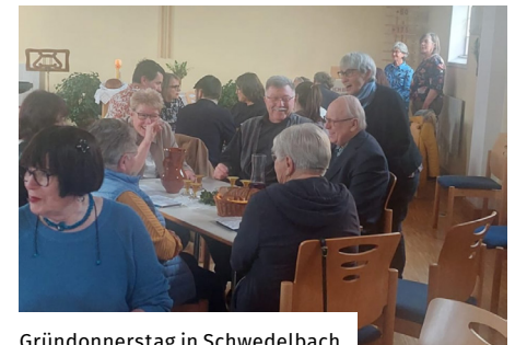
Gründonnerstag in Schwedelbach