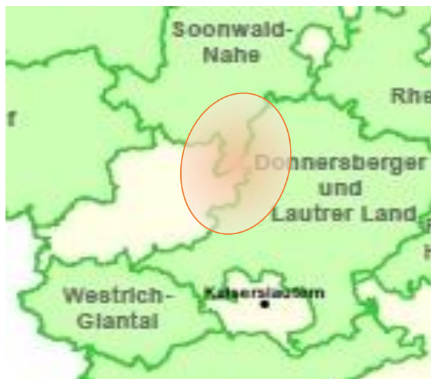
Verortung der Alten Welt

Über die genaue Lage der „Alten Welt“ lässt sich kontrovers diskutieren. Weitgehende Einigkeit herrscht dabei, dass sie zwischen den drei Flüssen Alsenz, Glan und Lauter liegt. Die Ellipse unten in der Karte zeigt diesen Bereich auf.