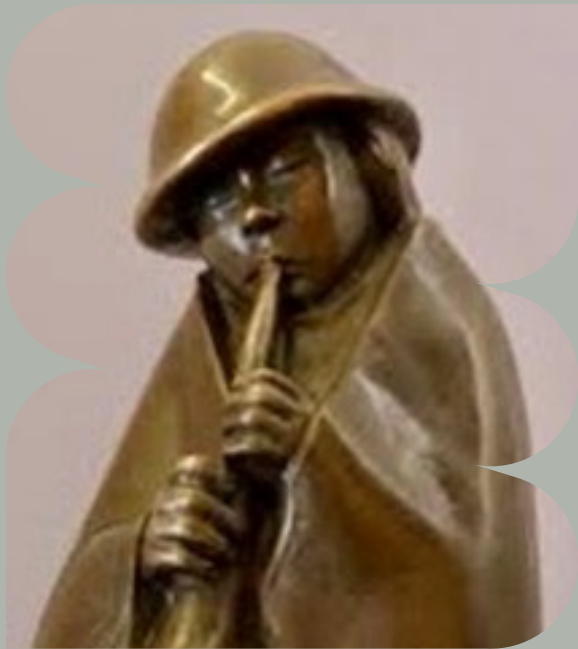
Flötenspieler (Ernst Barlach)

In sich lauschend, hört er die Melodie seiner Seele, von Gott für ihn entworfen, von ihm gespielt für Gott.